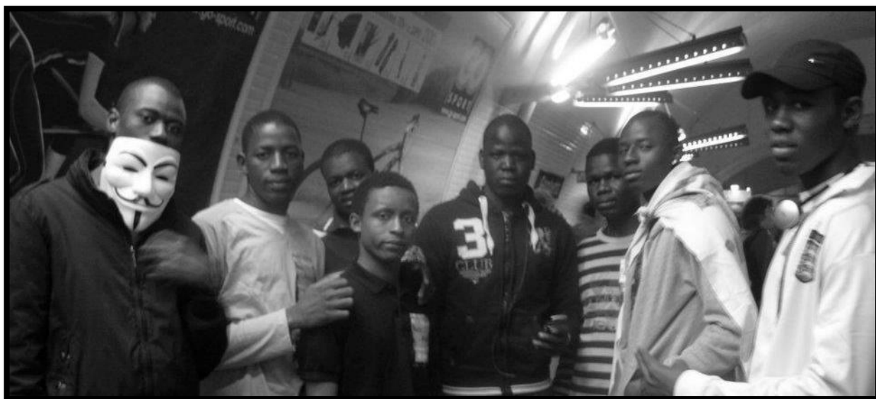
Les jeunes du D.M.A. se rendant à la manifestation